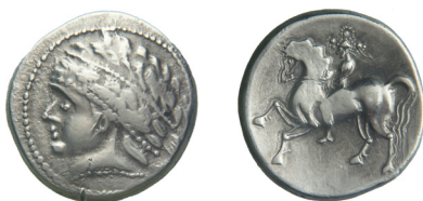
Fig. 13. „Kugelreiter” típus (MNM ET A N.I.4615.)

kardok esetében. Bár hozzá kell tennem, hogy egy ezüstpénz esetében a bevágás nem teszi lehetetlenné értéként való felhasználását, hacsak valami komoly és komolyan is vett tabu nem áll mögötte. A súlyra mért nemesfém formájától függetlenül is érték, és nem csak az ősi társadalmakban.