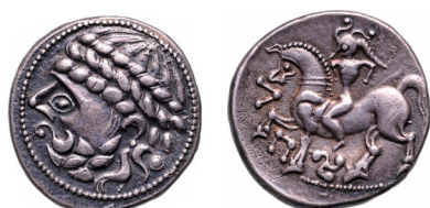
Fig. 10. Mászlonypusztai típus (MNM ET A Dess. 1179.)