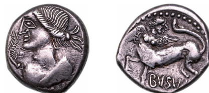
Fig. 15. Boi hexadrachma BVSV felirattal (MNM ET A Dess. 150.)