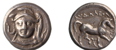
Fig. 6. Audoleon paion király tetradrachmája (MNM ET A 192A.1915.7.)