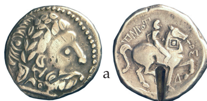
Fig. 7. Honti típus (MNM ET_A N.I.5338 és 5341.)