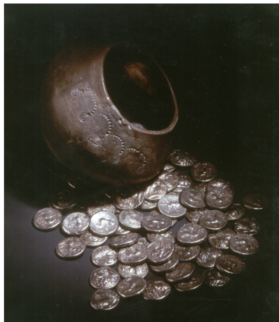
Fig. 2. Egyházasdengelegi éremkincs (MNM)

A Kárpát-medencében a legkorábbi kelta érmek Nógrád, Heves, Pest megye északi részén, valamint Közép-Szlovákia déli részén a Kr.e. 3. század közepe tájára keltezhetők. 11 A honti típus, továbbá az ún. Audoleon utánzatok (felirattal, illetve a nagyon hasonló és velük gyakran előforduló ún. Dreizack ) mind jó minőségű ezüstből, nagy súllyal (13 g körül) készültek és rendszerint alig mutatható ki rajtuk a használat nyoma. Főként kincsleletekből ismertek, 12 illetve néhány szórvány példány időnként távolabb is eljutott a feltételezett készítési helytől. 13 Az érmék II. Philipposz tetradrachmáinak (Fig. 3) egyik típusát utánozták, az előlapon Zeusz szakállas babérkoszorús feje, a hátlapon egy lovas, egy ruhátlan, palmaágot tartó ifjú. Ez az érmekép gyakorlatilag az egész Kárpát-medencei kelta pénzverés alaptípusa és hosszú időn át szolgált érmeképként, a ló ábrázolás pedig még az idővel megjelenő kiscímletek egy részén is tovább élt. Az érmekép választása bizonyára nem volt véletlen, ha csak a legcsekélyebb tudatosságot is feltételezzük a kibocsátók részéről. Hogy a philippeusok lettek volna a leggyakoribb veretek a Kr.e. 4–3. század fordulóján, nem hinném, hiszen Nagy Sándor Héraklész fejet és trónoló Zeuszt ábrázoló ezüstpénzeit óriási mennyiségben bocsátották ki még az utódai is. 14 A kelta harcosok viszont, akinek