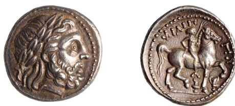
Fig. 3. II. Philipposz tetradrachma (MNM ET A 96.1937.9.)