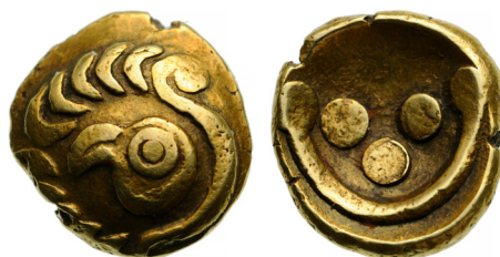
Fig. 1. Vindelikus arany érem (MNM ET A 52.1872.1.)