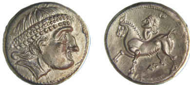
Fig. 12. Kroisbachi típus (MNM ET A 53.1910.4d.)