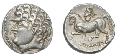
Fig. 11. Kroisbachi típus (MNM ET A 2008A.4.1.)