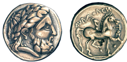
Fig. 5. Audoleon utánzat felirattal (MNM ET A N.I.5356.)