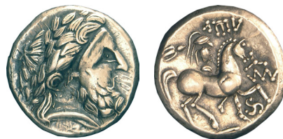
Fig. 8. „Dreizack” típus (MNM ET A N.I.5369.)

lovasa is egy sisakos lovas, tehát nem a győztes ifjú, hanem egy harcos. A honti típus egyes példányain is található felirat maradványok, időnként Philipposz vagy Audoleon név ismerhető fel bennük, de távolról sem olyan határozottan, mint az előbb említett típuson (Fig. 7). Ezek az érmek kivitelre sem olyan jók, mint az Audoleon feliratosak, avagy az azokkal időnként közös kincsben szereplő „Dreizack”. Sajnos nem tudjuk, hogy mit jelentenek a beponcolt jegyek a honti típus lovainak nyakán, avagy az Audoleon feliratosokon az utólagosan beütött triszkelesz jegy. Ez utóbbi jegy a „Dreizack”-on már az éremkép része lett (Fig. 8). Ezek az éremverések jól kapcsolhatók a balkáni hadjáratokból visszatért kelta harcosokhoz, akiknek vezetői a saját maguk által kibocsátott pénzekkel jutalmazták embereiket. Hogy az érmék miért kerültek földre, erre nincs egyértelmű adat, de nem zárnam ki azt a lehetőségét sem, hogy esetleg valóban rituális okból ásták el valamiféle áldozat gyanánt. A leletkörülmények ismeretének hiányában sajnos ezt sem megerősíteni, sem cáfolni nem tudjuk. A honti típusokon látható bevágásoknak is lehet rituális magyarázata, mint az összetört, meghajlított