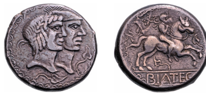
Fig. 14. Boi hexadrachma BIATEC felirattal (MNM ET A Dess. 138.)

Mindez természetesen csak feltételezés, melyen éppen úgy, mint a pénzek rituális szerepén, jócskán lehet vitatkozni, érveket mellette és ellenében felhozni. De már csak ilyen ez a szakma, időről időre új szempontok kerülnek előtérbe, újabb elméletek születnek, vagy ismét felbukkannak a régebbiek, és ezeket olykor sikerül bizonyítani is, újabb leletekkel alátámasztani.