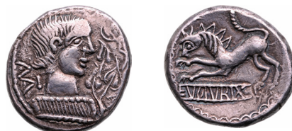
Fig. 16. Boi hexadrachma EVIVRIX felirattal (MNM ET A 68.1883.2.)