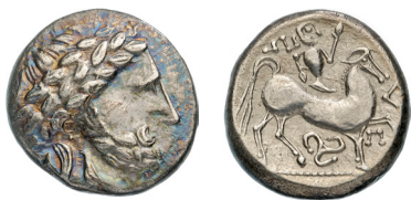
Fig. 9. Zichyújfalusi (Triszkelesz) típus (MNM ET A 208.1874.1.)