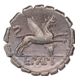
Fig. 1. Papius dénár hátlapja (RRC 384/1. Róma Kr.e.79) MNM ET-A R.I.519.