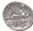
Fig. 2. Papius dénár eraviscus utánzata (rev) MNM ET-A 65.1901.10.