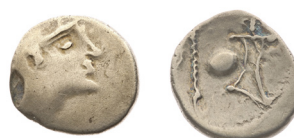
Fig. 16. „Bia típusú” eraviscus dénár MNM ET-A R.I.6620. Torbágyi 1984. C/8f.