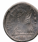
Fig. 8. Roscius Fabatus dénár eraviscus utánzata (rev.) MNM ET-A N.I.4814.