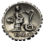
Fig. 7. Roscius Fabatus dénár hátlapja (RRC 412/1. Róma Kr.e. 64) MNM ET-A 61.1905.37.