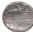
Fig. 10. Crepusius dénár eraviscus utánzata, un. Domisia típus MNM ET-A 65.1901.29.