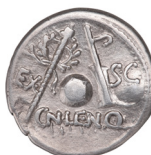
Fig. 3. Cornelius Lentulus dénár hátlapja (RRC 393/1a. Hispania Kr.e. 76/75 MNM ET-A R.I.271.