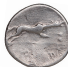
Fig. 6. Postumius dénár eraviscus utánzata (rev.) MNM ET-A 70.1901.