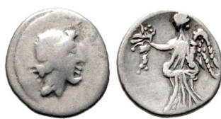
Fig. 14. Eraviscus "quinar" Rauch 101, 1269.

Duteuti) neve megjelenik a pénzeken egyfajta presztízis pénzverést feltételezhet, amellyel a közösség, a törzs kiváltságos helyzetét kívánta hangsúlyozni. Nem kizárt, hogy a rómaiak egy szövetségi kapcsolat létesítettek a békés eraviscusokkal, 38 melynek keretében a vezetők pénzt kaptak, majd ezek mintájára maguk is saját pénzkibocsátásba kezdtek. A korai polgárjog adományozás néhány törzsi vezetőnek egy ilyen kapcsolat létrejöttére utalhat. (CIL III 3377, 10552) A Julius Caesar által meghódított Gallia területén a római uralom kezdeti évtizedeiben