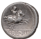
Fig. 9. Crepusius dénár hátlapja (RRC 361/1a. Róma Kr.e. 82) MNM ET-A R.I.279.